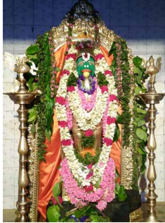
அசோகவன அனுமனாய் காட்சியளிக்கும் மூலவர் ஜெயமங்கல ஆஞ்சநேயர்.